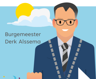
Burgemeester Derk Alssema

500 We vieren in 2024 en 2025 het jubileumjaar 500 jaar Rijen. We stellen geld beschikbaar om hier met activiteiten en evenementen bij stil te staan.